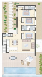
PLANTA BAJA GROUND FLOOR