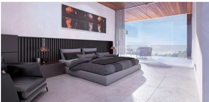
◆ GROUND FLOOR - PLANTA BAJA