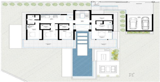
FIRST FLOOR - PRIMERA PLANTA

THE INTELLECTUAL PROPERTY OF THE DRAWING HERE REPRESENTS, ACCORDING TO THE REGULATIONS, IS ONE OF THE ELEMENTS CONSTITUTING THE PROJECT AND IS NOT TO BE REPRODUCED OR USED IN ANY MANNER WITHOUT THE EXPRESS PERMISSION OF THE ARCHITECT.